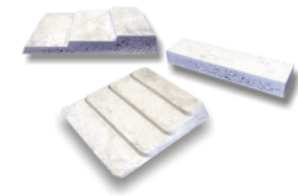
Integralschaum aus der Mg-Legierung AZ 91, hergestellt in einem modifizierten Druckgießverfahren